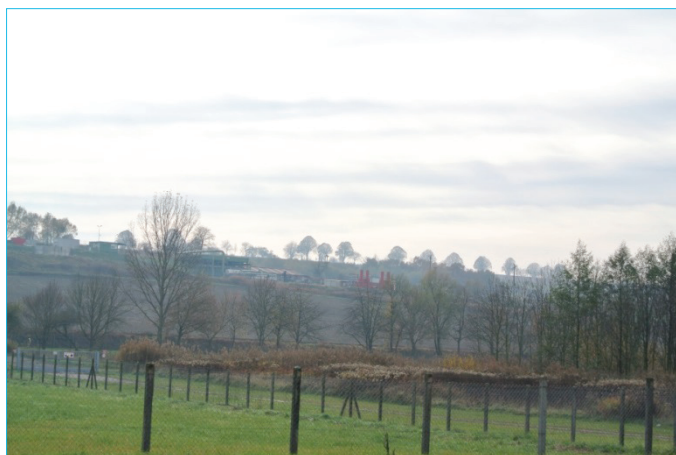
Una planta de energía geotérmica integrada en el paisaje

El desarrollo geotérmico promovido por el proyecto GeoElec debe llevarse a cabo de un modo sostenible. Se hace necesario el establecimiento de un marco regulatorio para los procedimientos de otorgamiento de licencias, propiedad de los recursos y competencia para el uso del espacio subterráneo, pero este marco debe ser simplificado. Siguen existiendo barreras regulatorias que pueden causar demoras e incrementos en los costes de los proyectos de generación eléctrica con geotermia, y deben ser eliminadas. Deberá tenerse en cuenta el impacto medioambiental de todos los proyectos de infraestructura, y las normativas medioambientales son importantes herramientas para el desarrollo de la generación eléctrica con geotermia.